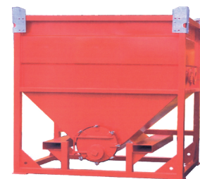
Depósito decantador de filtrado y recogida de sedimentos

pacios urbanos y los modelos con bombas sumergible hidráulicas accionadas por un grupo hidráulico autónomo. Con esta gama de equipos de bombeo TST lidera el mercado de las bombas de agua de alquiler.