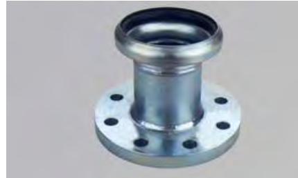
BRIDA CON TOMA BAUER HEMBRA