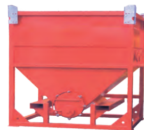
Depósito decantador de filtrado y recogida de sedimentos

pacios urbanos y los modelos con bombas sumergible hidráulicas accionadas por un grupo hidráulico autónomo. Con esta gama de equipos de bombeo TST lidera el mercado de las bombas de agua de alquiler.