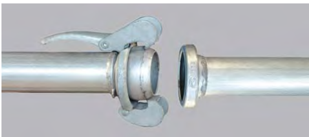
TUBO DE ALUMINIO O ACERO CON TOMAS BAUER