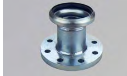
BRIDA CON TOMA BAUER HEMBRA