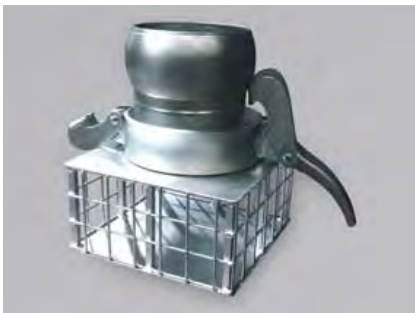
FILTRO COLADOR CON TOMA BAUER MACHO