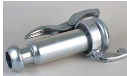
REDUCCIÓN CON TOMAS BAUER MACHO HEMBRA