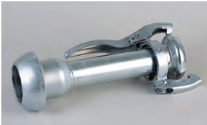
REDUCCIÓN CON TOMAS BAUER HEMBRA MACHO