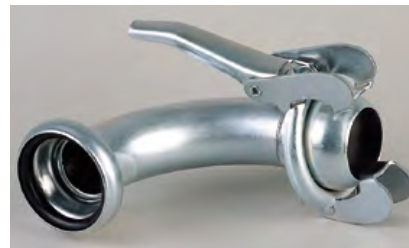
CURVA 90° CON TOMA BAUER HEMBRA MACHO