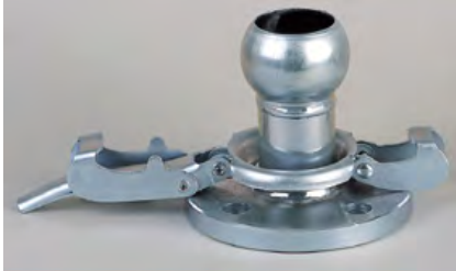
BRIDA CON TOMA BAUER MACHO