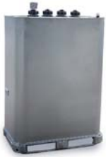
Depósitos de Combustible