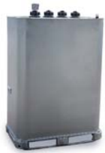
Depósitos de Combustible