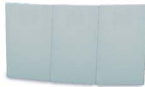
Cerramiento modular decorativo