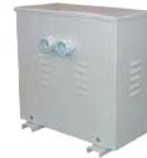
Autotransformadores trifásicos reversibles