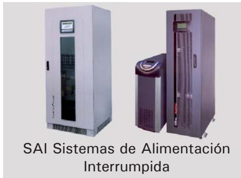
SAI Sistemas de Alimentación Interrumpida