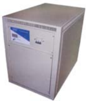
Estabilizador de corriente